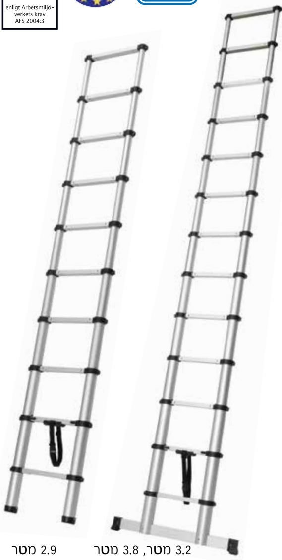
2.9 מטר 3.2 מטר, 3.8 מטר

מנגנון נעילת שלבים מרוסן איכותי ובטיחותי